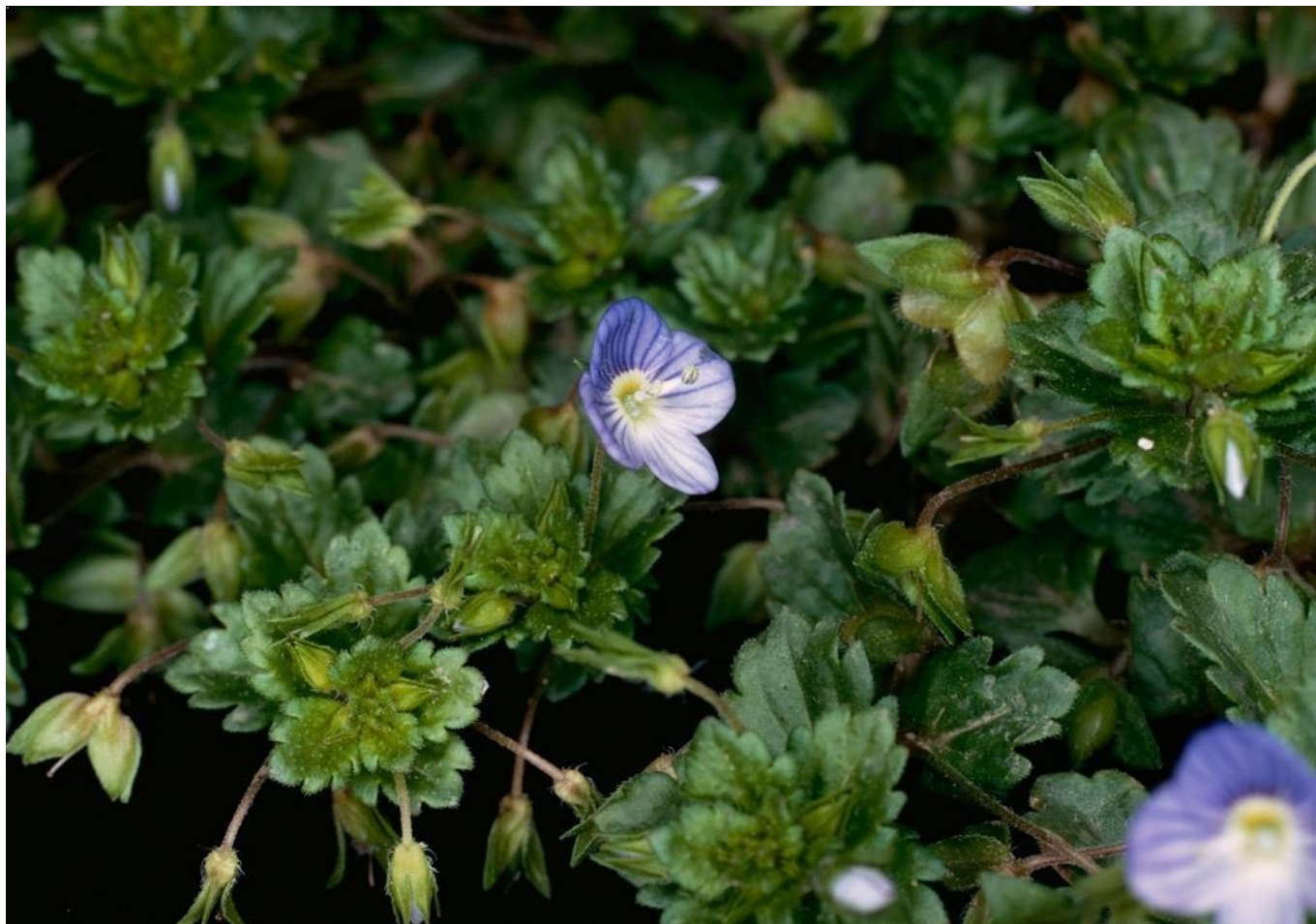
Véronique de Perse