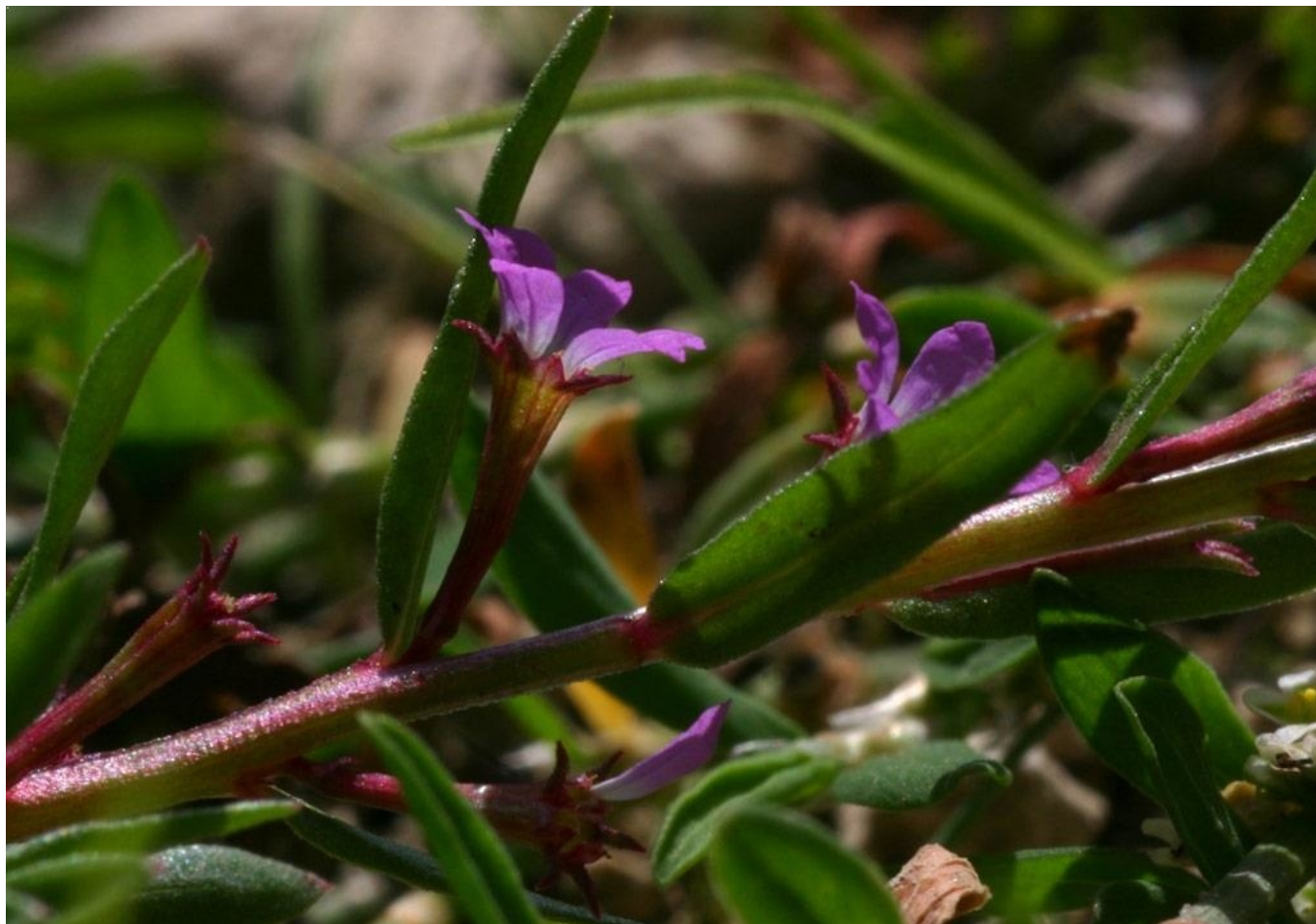
Salicaire à feuilles d'hysope