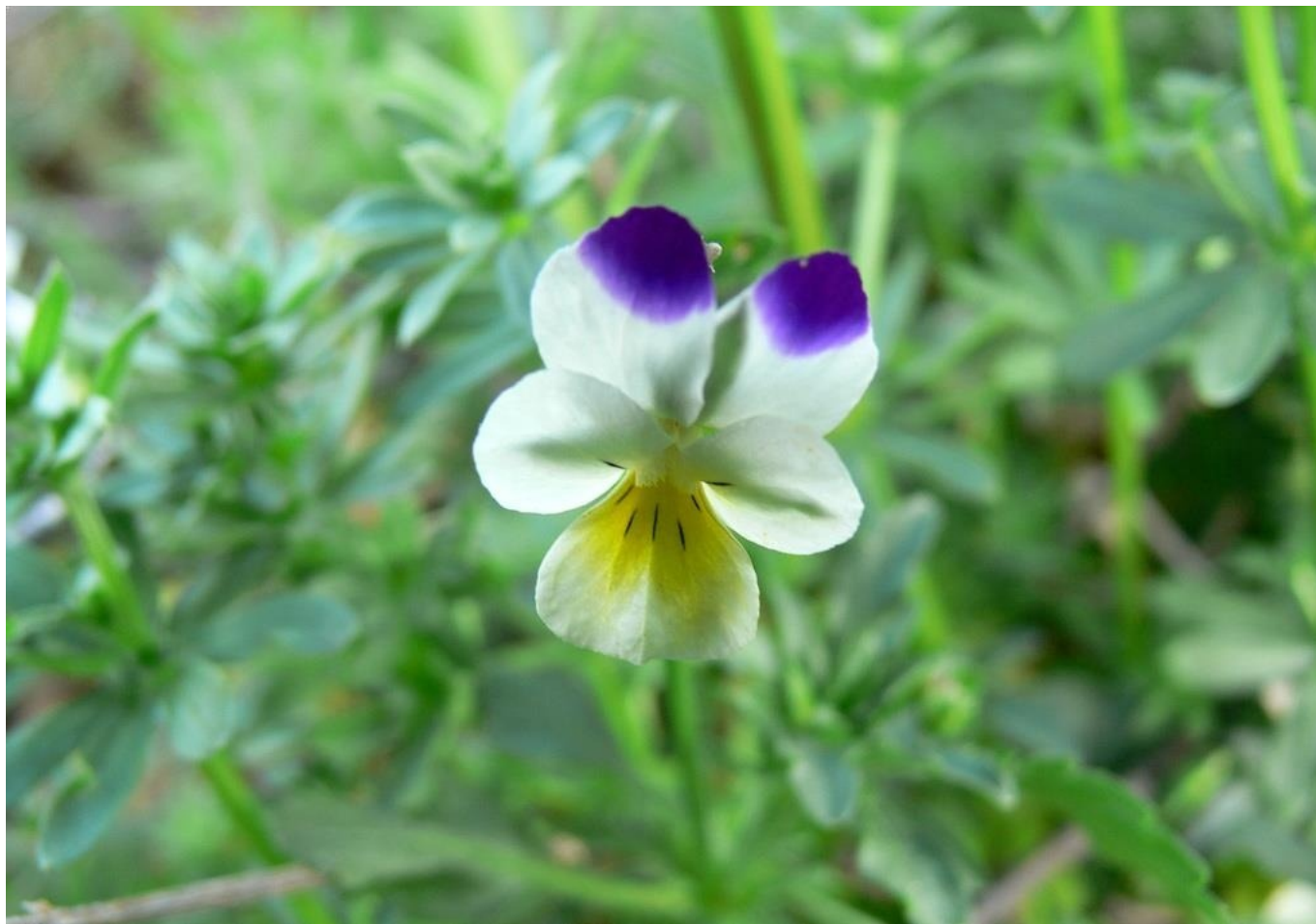
Pensée des champs