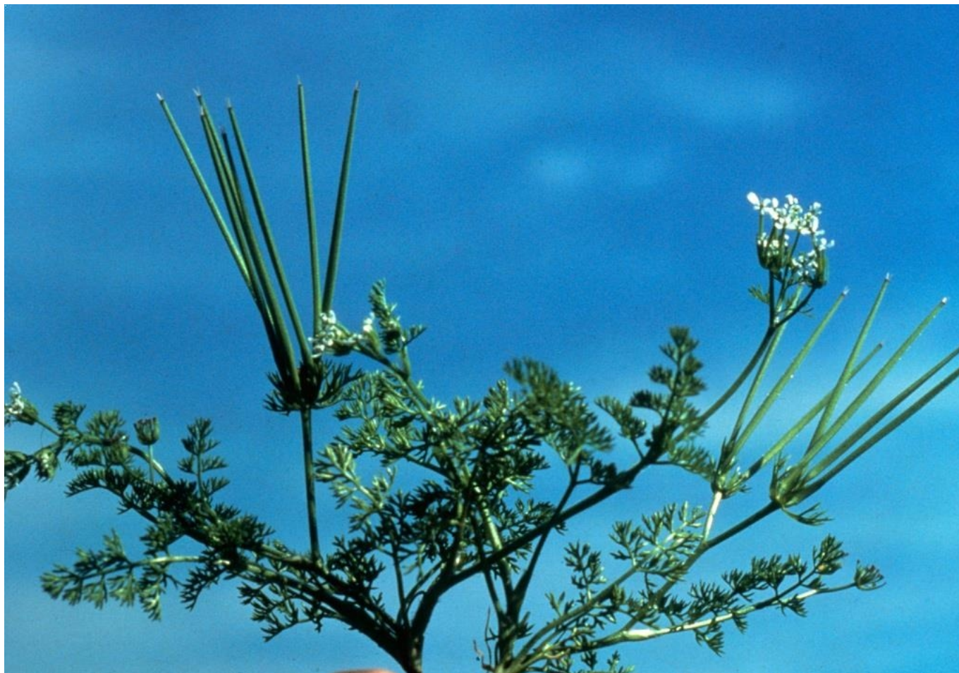
Peigne de Vénus