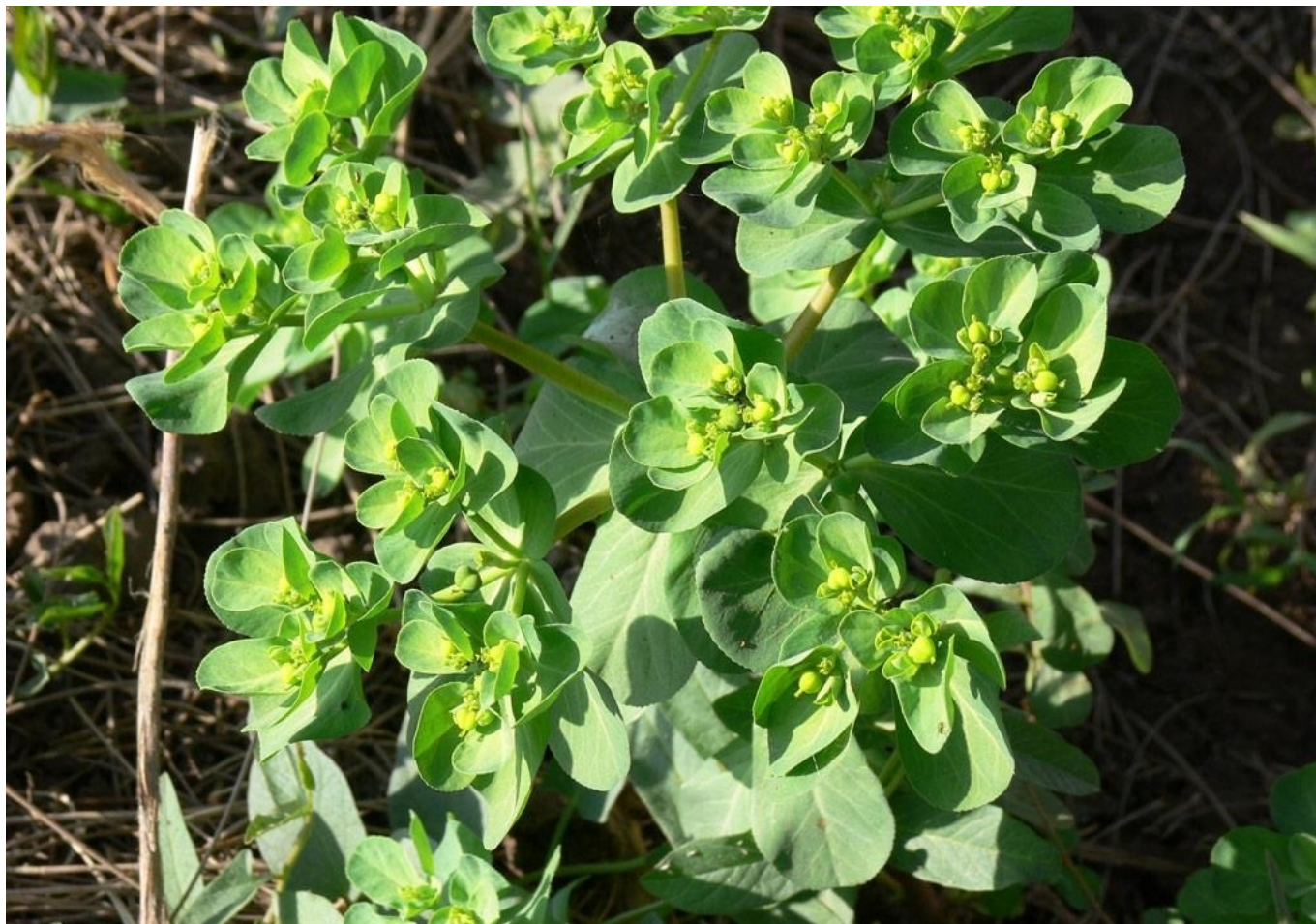
Euphorbe réveil matin