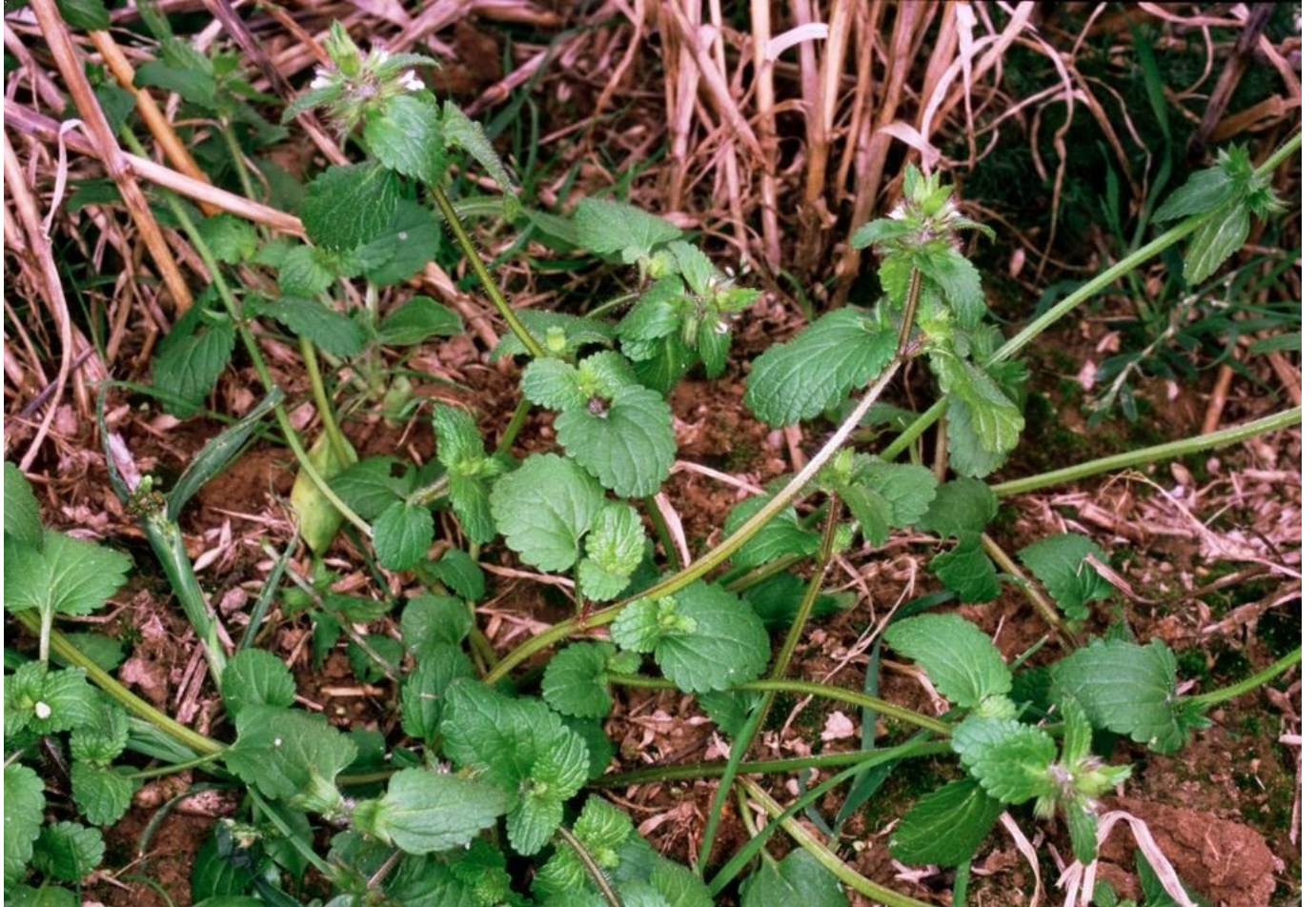
Epiaire des champs