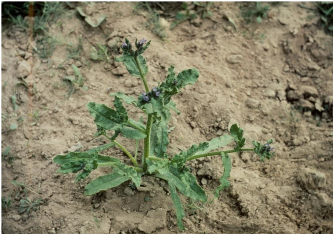
Buglosse des champs