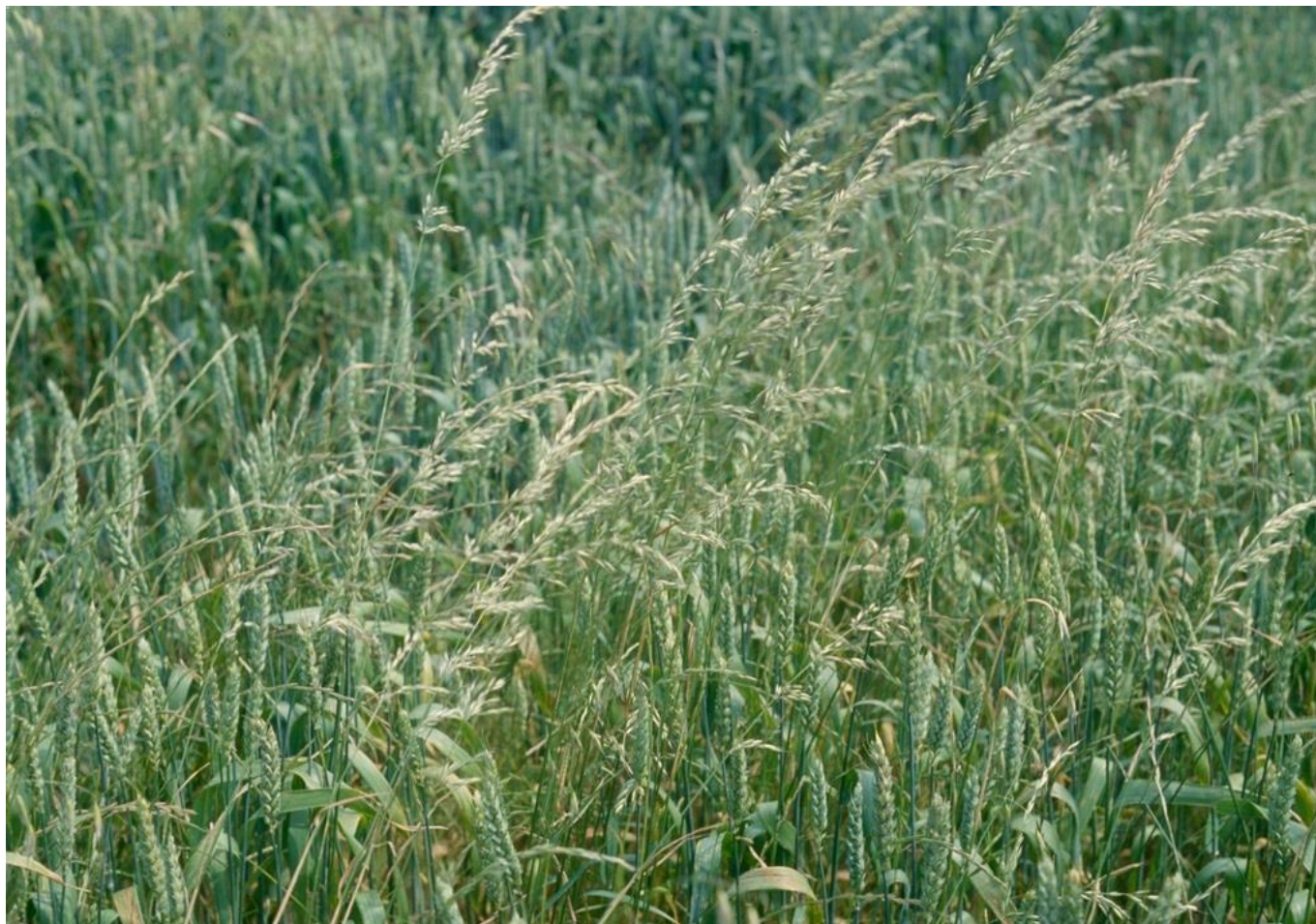
Avoine à chapelets