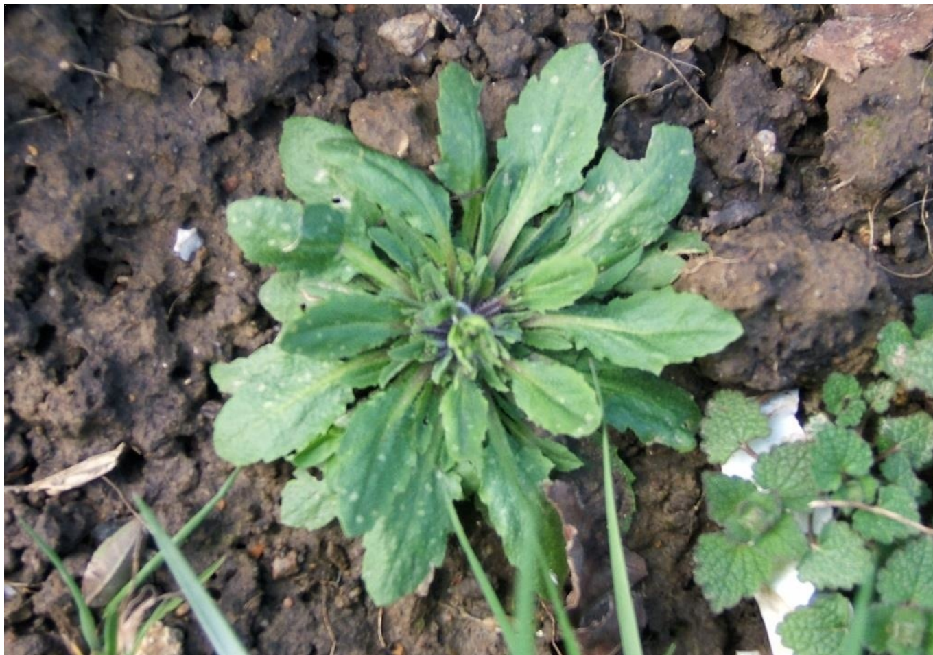
Arabette de Thalius