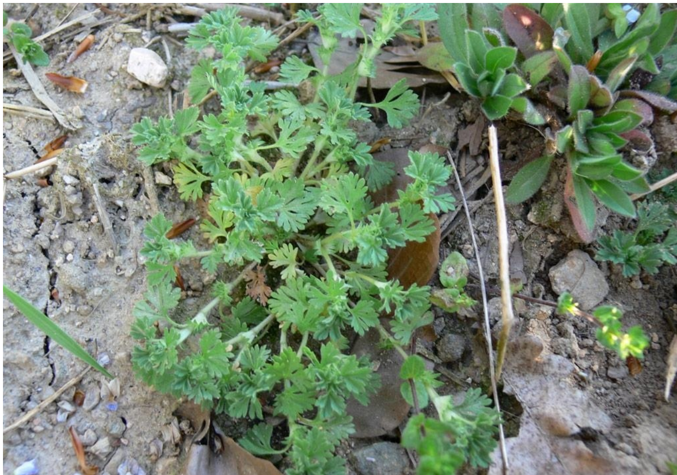
Alchemille des champs