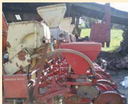
Semoir Benac : B600