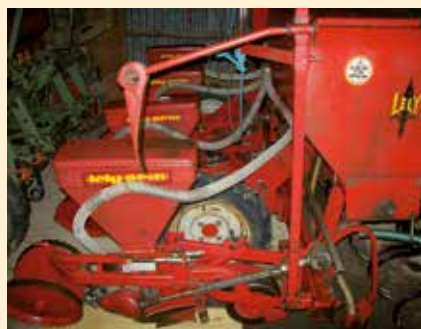
Semoir Lely : Lelysem

Ce kit à socs permet d'équiper 2 éléments semeurs. Description du matériel pour 1 élément semeur :